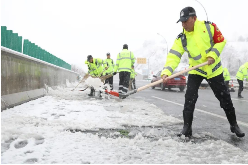
宜春宜万同城路段积雪严重,市公安局交警支队袁州大队组织警力沿途除冰铲雪。

1月22日,大雪纷飞,如约而至的不止有美丽雪景,也给人们生活出行带来不便。在宜春有这样一群人,不畏大雪天,偏向雪中行,全力以赴战风雪,保畅通、护平安。他们的付出,让人们在寒冷的冬天感受到别样的温暖。