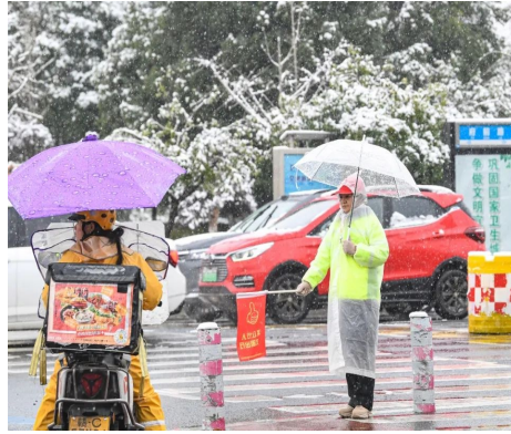
志愿者提醒路人注意安全。