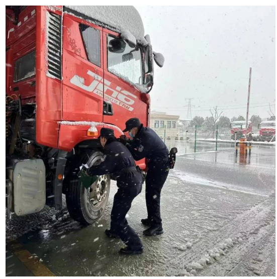
为了不影响查验进度,减少群众在雪中焦急等候的时间,高安市公安局交警大队车管所查验员冒雪开展车辆查验工作。