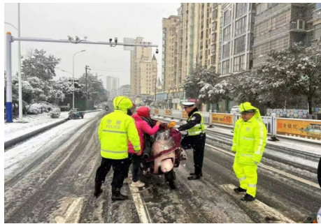
交警值守在宜春中心城区各路口,有序引导过往车辆和行人,确保道路安全通行。