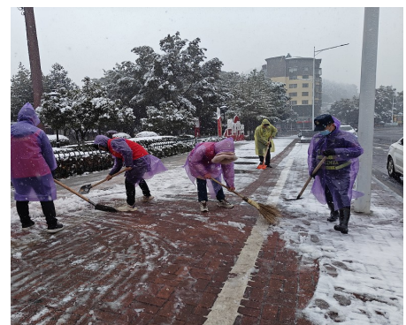
袁州区秀江街道昌黎社区第一时间组织社区干部联合秀江城管大队开展义务扫雪活动。(刘陈凡 摄)