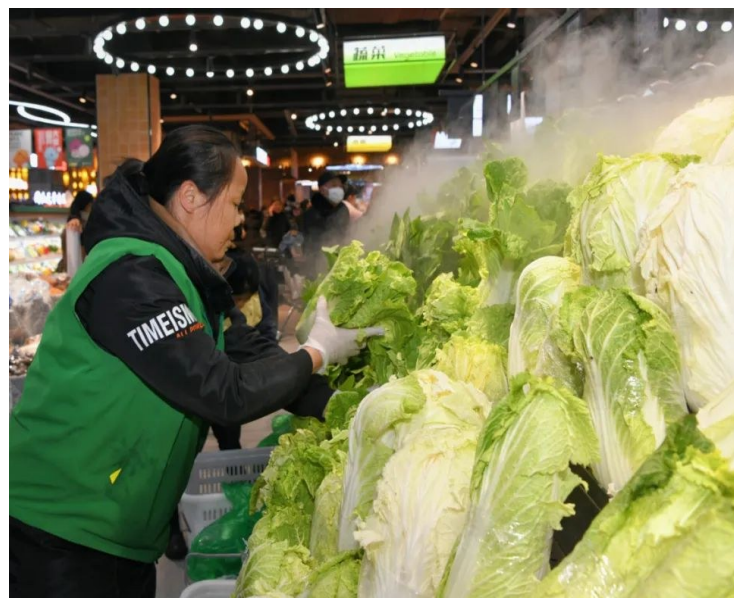
守好群众“菜篮子”,确保物资充足。市民在宜春中心城区商场内购买蔬菜。我市积极做好寒潮天气蔬菜保供工作。