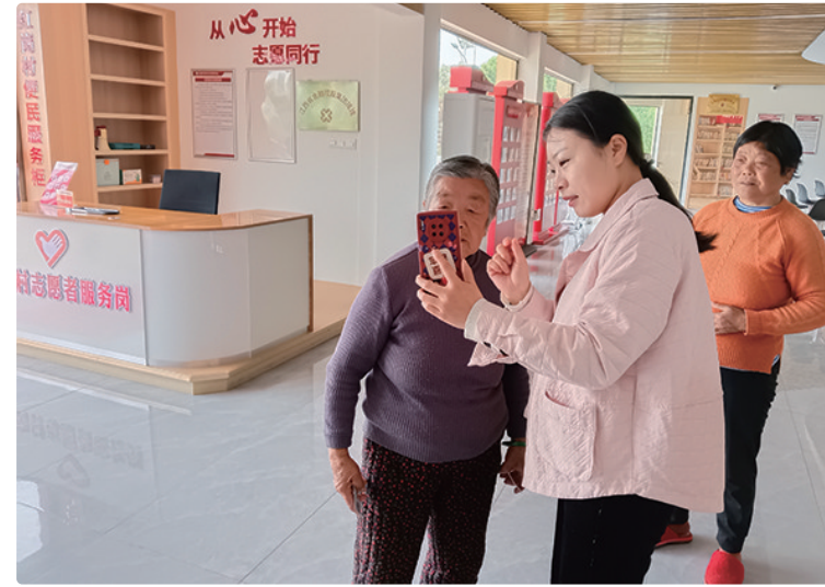
工作人员正在用手机为老年人进行认证。

本报讯 韩莉 徐翠微报道:为进一步提升养老保险规范化、标准化管理水平,确保养老保险待遇发放准确,杜绝虚报、冒领等现象发生,靖安县香田乡多措并举、齐动员,扎实开展养老保险资格认证工作。