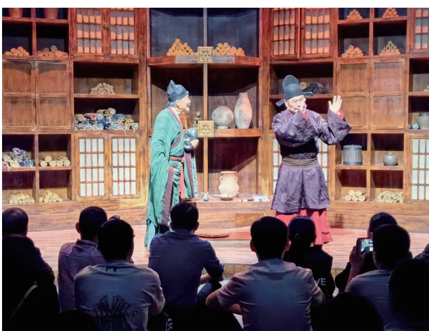
在高岭中国村大唐茶市观看话剧表演。