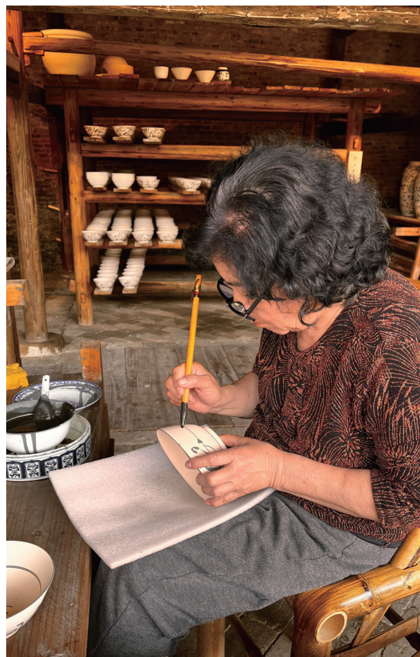
手工制瓷，精益求精。