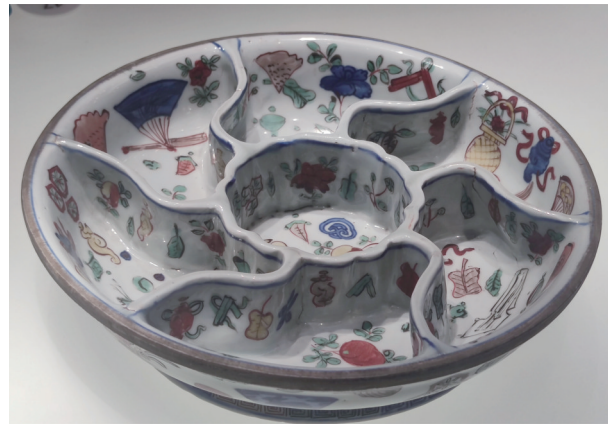
中国陶瓷博物馆展示的陶瓷文物。