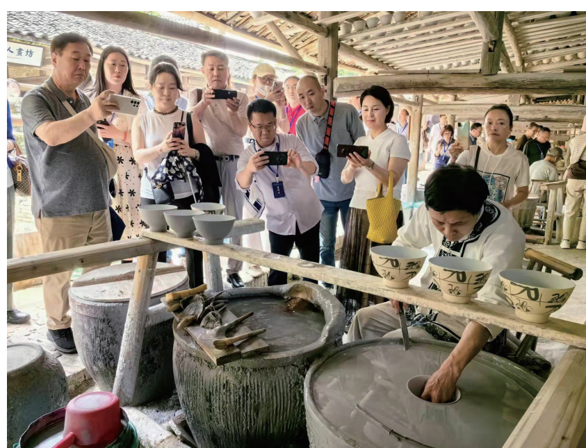
在古瓷民俗博览区参观手工制瓷技艺。